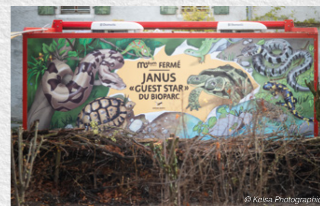
Remorque de Janus habillée par Medusa Design