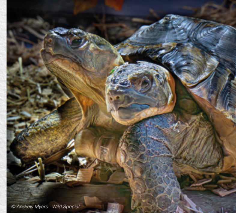
© Andrew Myers - Wild Special