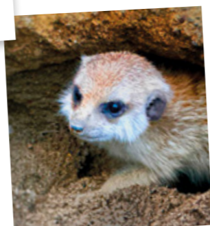
Fluffy, premier Suricate né dans le Canton de Genève