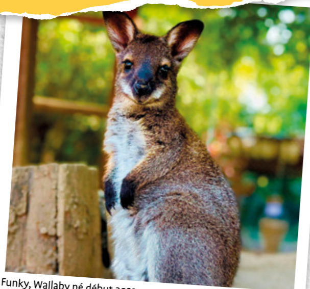
Funky, Wallaby né début 2023