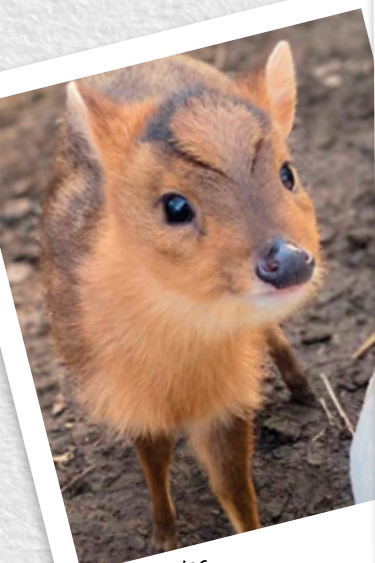
Bébé Muntjac