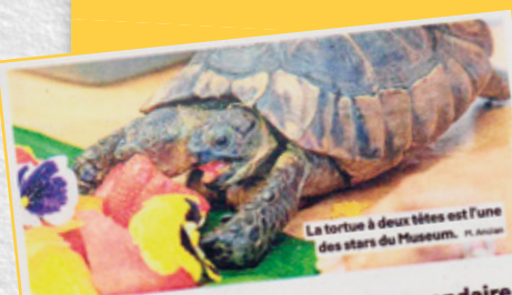
La tortue à deux têtes est l'une des stars du Muséum.

20 minutes, Le Courrier et GHI ont publié un article en version journal sur le déménagement de Janus.