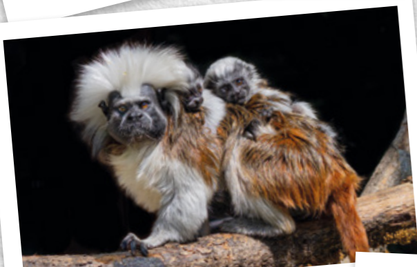
Tamarins pinchés