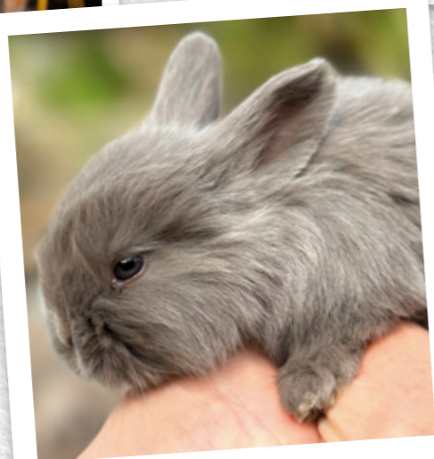
Lapin-renard © Andrew Myers - Wild Special