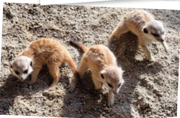
Triplés Suricates