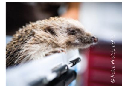
Hérisson sauvage relâché après son traitement au centre de soins du Bioparc