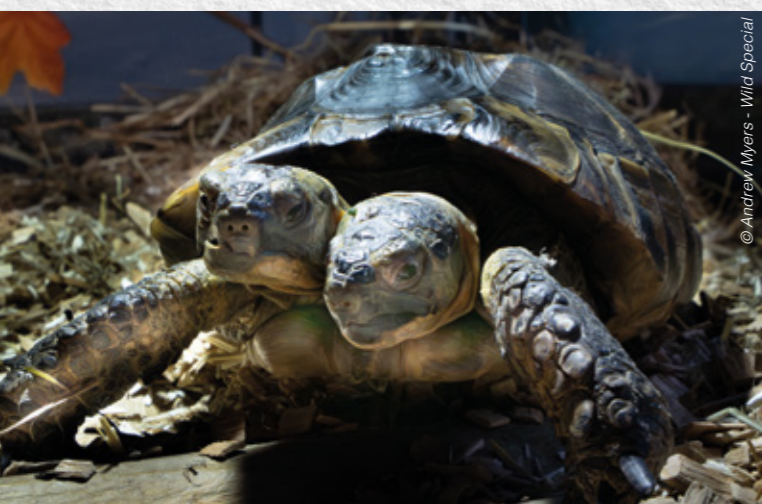
Janus au Bioparc

Ce mâle possède non seulement deux têtes, mais aussi deux cœurs, deux estomacs et quatre poumons ! Sa carapace est cependant de la même taille que chez les autres tortues Testudo graeca de son âge. La présence de doubles organes dans la partie supérieure de son corps empêche Janus de rentrer ses têtes et ses pattes sous sa carapace. Pour cette raison, Janus ne peut pas se protéger des prédateurs et serait une proie facile dans la Nature.