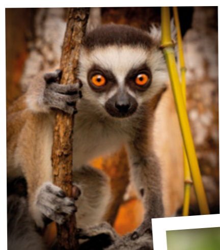
Florette, Lémurienne du mois d'avril 2023