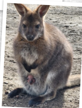
Fenouil et sa maman Etoile