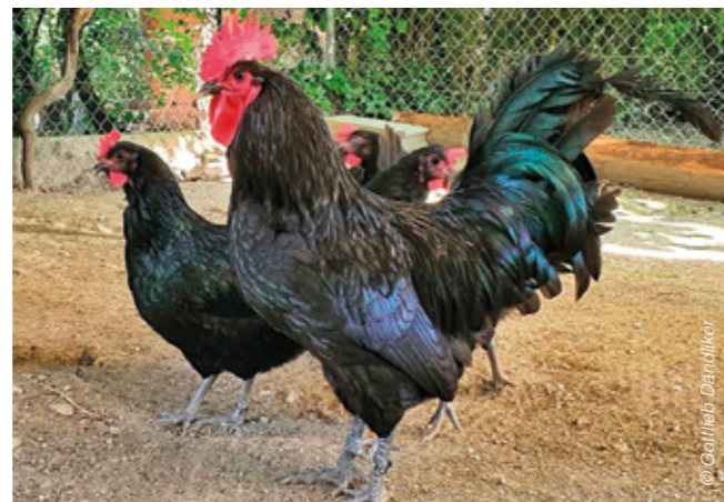
Poules noires de Janzé au Bioparc

Merci à la RTS pour son reportage «Mise au point» sur la lutte locale contre le frelon asiatique dans lequel s'inscrit ce projet.